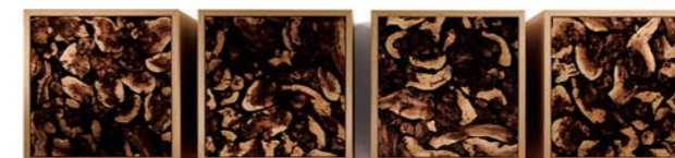
Loodusest inspireeritud riulid.

Baroksel külluslikud vormid segatuna modernse lihtsusega annavad ruumile piduliku ja elegantse ilme.